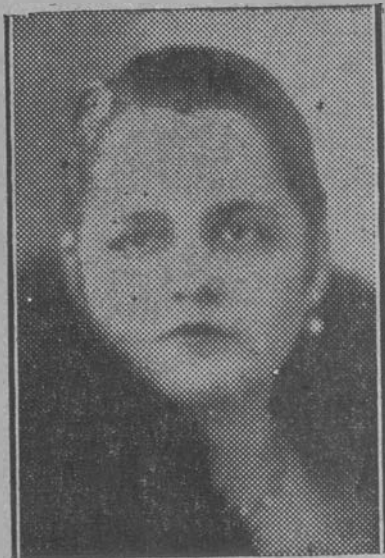
Excma. Sra. Doña ROSARIO GUARDIA DE ARIAS

Presentamos nuestro atento saludo y nuestra felicitación a la primera dama de la República doña Rosario Guardia de Arias, con motivo de la exaltación al poder de su ilustre esposo Excmo. Sr. Dr. Harmodio Arias M.