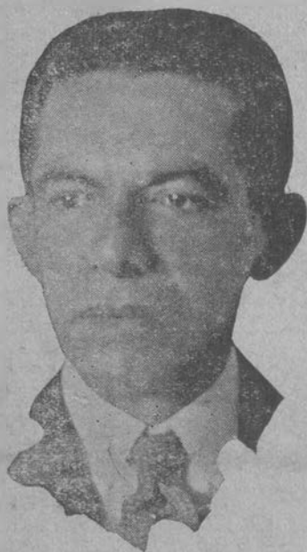
Excelentísimo Señor Doctor HARMODIO ARIAS M. Presidente de la República